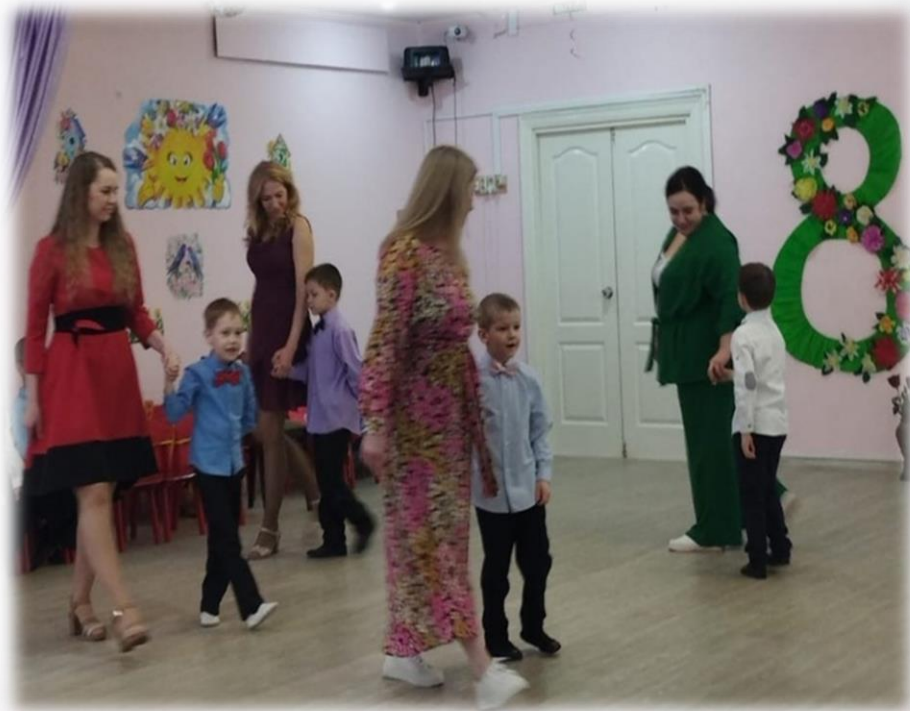
Танец мам и сыновей на 8 Марта