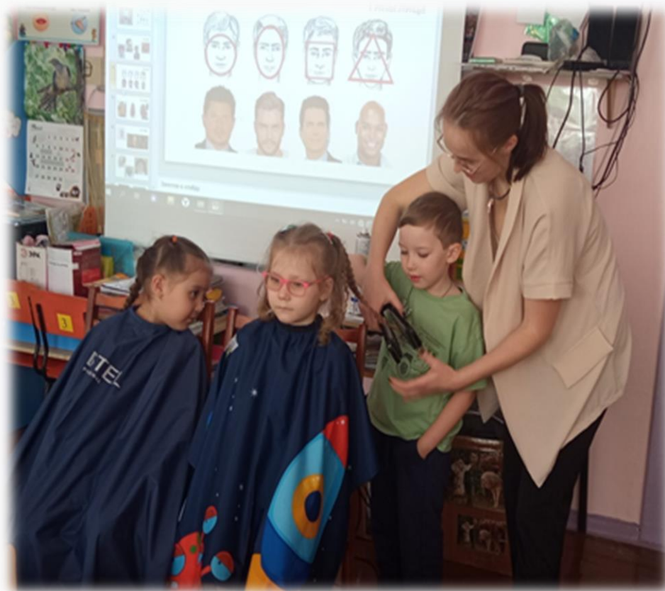
«Моя мама парикмахер»