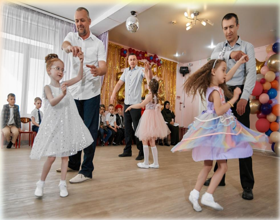
Танец пап и дочерей на выпускном