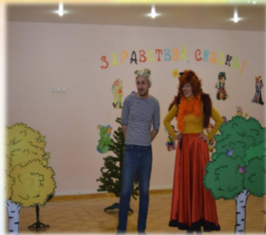
«Зайка Петя и его друзья»